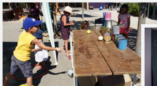
Kermesse du 10 juin