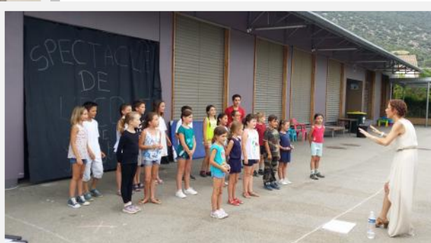
Spectacle du 23 juin