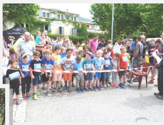
La course des enfants