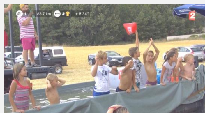
Les enfants se rafraichissent en attendant la caravane et les coureurs