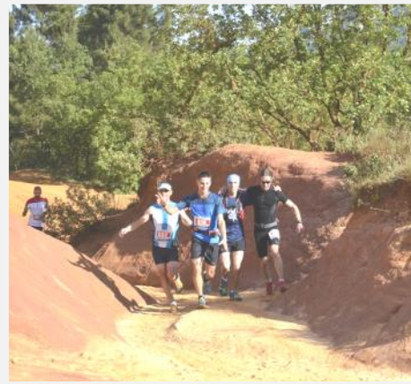
L'équipe de la Rustrelienne.

A l'année prochaine pour la 8 ème édition de la Rustrelienne le 13 mai 2018 !