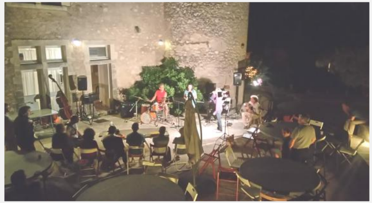
Concert en public en 2016

La moitié des participants sont logés au gîte d'étape du château, les autres à l'extérieur (hôtel, gîtes, camping).