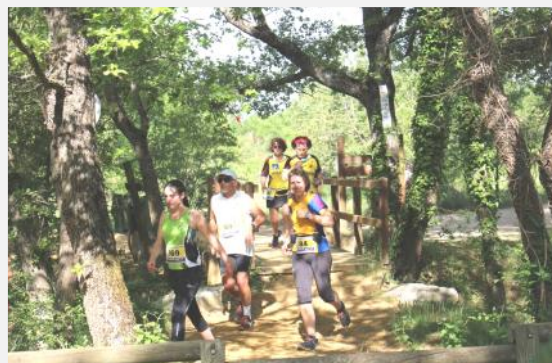
A la Rinsoulette